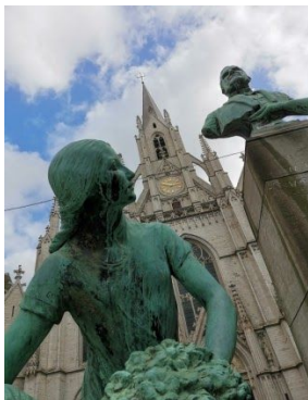
Point de vue d'un Lycéen à Bruxelles.