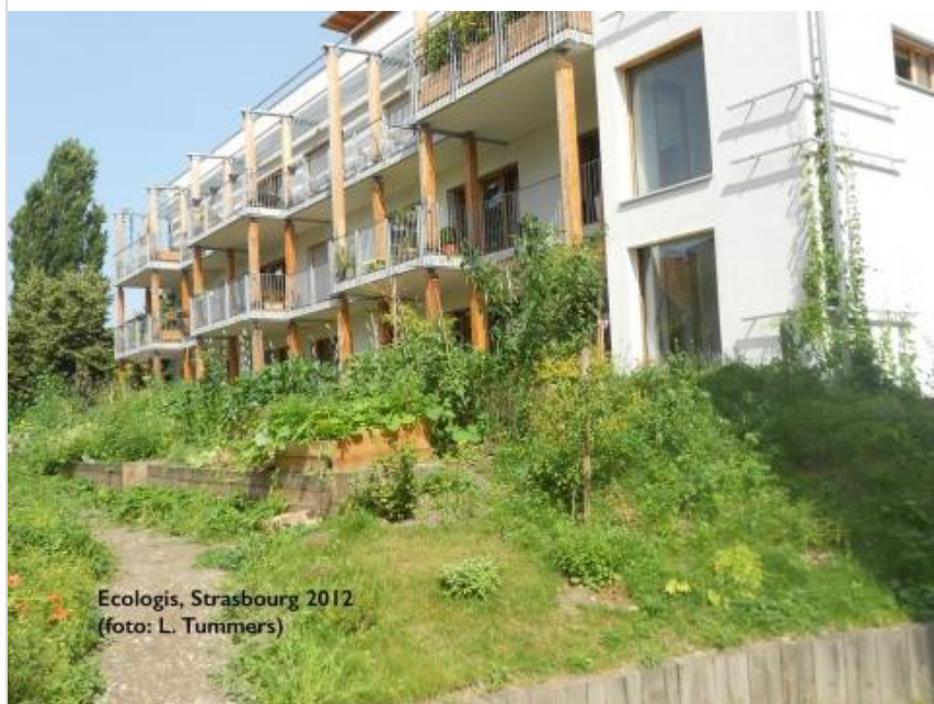
Eco-Logis est le premier projet d'autopromotion réalisé à Strasbourg