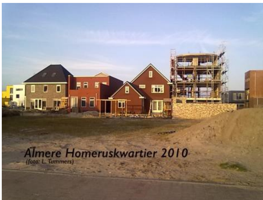
Construction du quartier Homerus à Almere en autopromotion individuelle

« ... Les modèles d'habitat participatif observés en Allemagne et aux Pays-Bas sont très différents, mais reposent tous sur l'idée que l'accession à la propriété d'un logement assure un lien prolongé avec la ville, un ancrage, un investissement et un intérêt immédiat des habitants pour la qualité de vie de leur quartier. Pour les responsables politiques allemands, l'habitat participatif est un moyen de produire des quartiers plus conviviaux, mais aussi plus solidaires, du fait de la mutualisation des ressources, des espaces et des services du quotidien (particulièrement pour les ménages les plus fragiles : les personnes âgées, les jeunes, les familles monoparentales), et d'avantager dans le même temps l'écoconstruction. L'expérience d'Homère, quant à elle, ne se fonde pas sur la mutualisation comme dans les baugruppen allemands pour favoriser la vie de quartier, mais sur une dynamique d'échanges et d'interconnaissances entre les primo-accédants pendant le temps de la conception. Si l'intégration de services ou de commerces n'est pas initialement prévue dans le programme, il est clairement attendu que les habitants participent à leur développement selon leurs aspirations, leurs besoins et dans une logique d'autogestion (entretien Tellinga, janvier 2012).