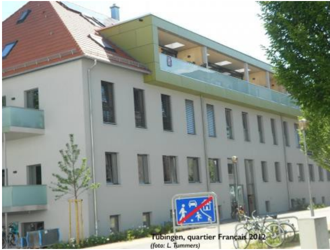
PHOTO : L'ancienne Caserne du Quartier Français à Tübingen a été rénovée en logements sociaux

Le caractère pionnier de ces trois quartiers contribue à la construction d'une identité habitante forte et à la mise en valeur des espaces produits. Si, au début des années 90, le quartier français et Loretto étaient des non-lieux coupés du reste de la ville, ils sont désormais régulièrement visités, notamment pour leur offre culturelle. Les commerces, locaux associatifs ou jardins réalisés par les groupes d'habitants en rez-de-chaussée sont devenus des espaces de sociabilités qui font des ensembles de logements des sortes de « villages dans la ville » (Lietaert, 2012).