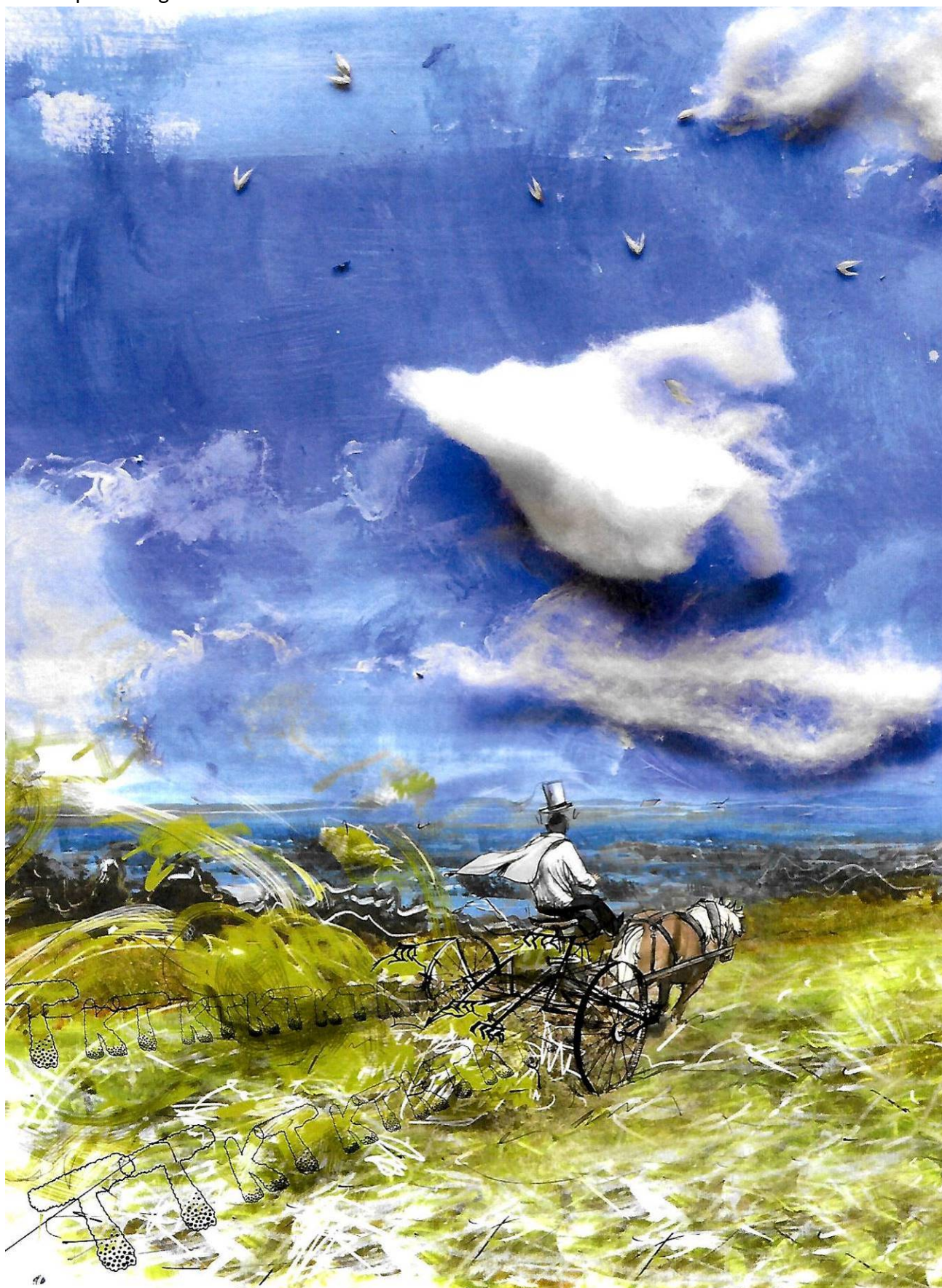
A la Berthe, la réintroduction de la traction animale fait partie du projet ECM-0004 - Habiter la campagne autrement