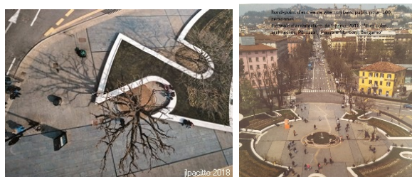
Projet de rond-point banc public pour 100 personnes de l'architecte portugaise Ines Lobo, entrée de ville de Bergame Biennale de Venise 2018