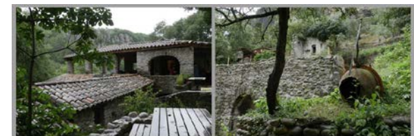
LE VIEL AUDON