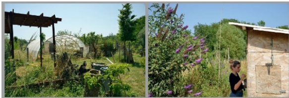
JARDIN SOLIDAIRE JHADE