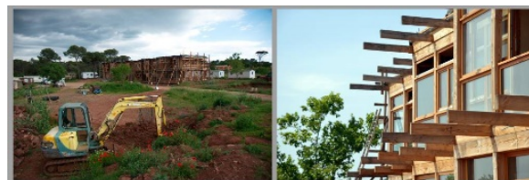
BOIS DE BRINDILLE