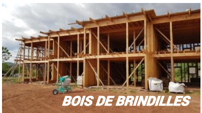
BOIS DE BRINDILLES

ITINÉRAIRE PROPOSÉ Bois de Brindille, le Cannet des Maures LA MAISON OASIS, à Lorgues Draguignan St Francois et Kairos Forcalquier : Les Colibres et Cooplicot Bonus 1 : Les jardins solidaires JHADE Bonus 2 : L'éco hameau Combes Jauffret