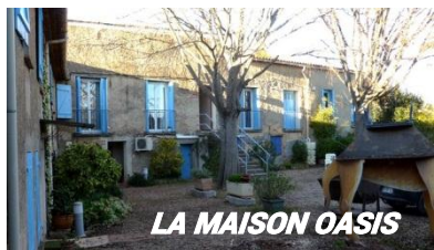
LA MAISON OASIS