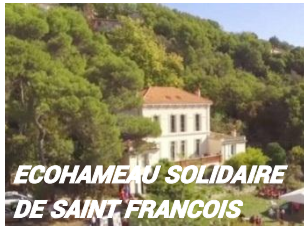
ECOHAMEAU SOLIDAIRE DE SAINT FRANCOIS