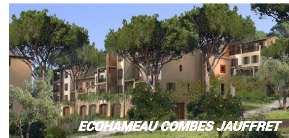
ECOHAMEAU COMBES JAUFFRET