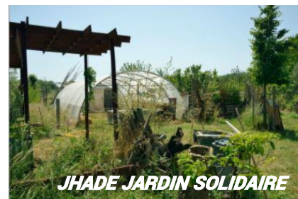
JHADE JARDIN SOLIDAIRE