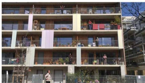
La coopérative d'habitants ABRICOOP à Toulouse pendant le confinement

Restez chez vous !, nous intimait le gouvernement le 16 mars dernier nous ramenant à l'importance de la qualité de notre logement pendant le confinement. Un luxe réservé aux plus riches ? Le mouvement coopératif défend une autre idée de l'habitat que la pandémie du Covid-19 pourrait enfin favoriser.