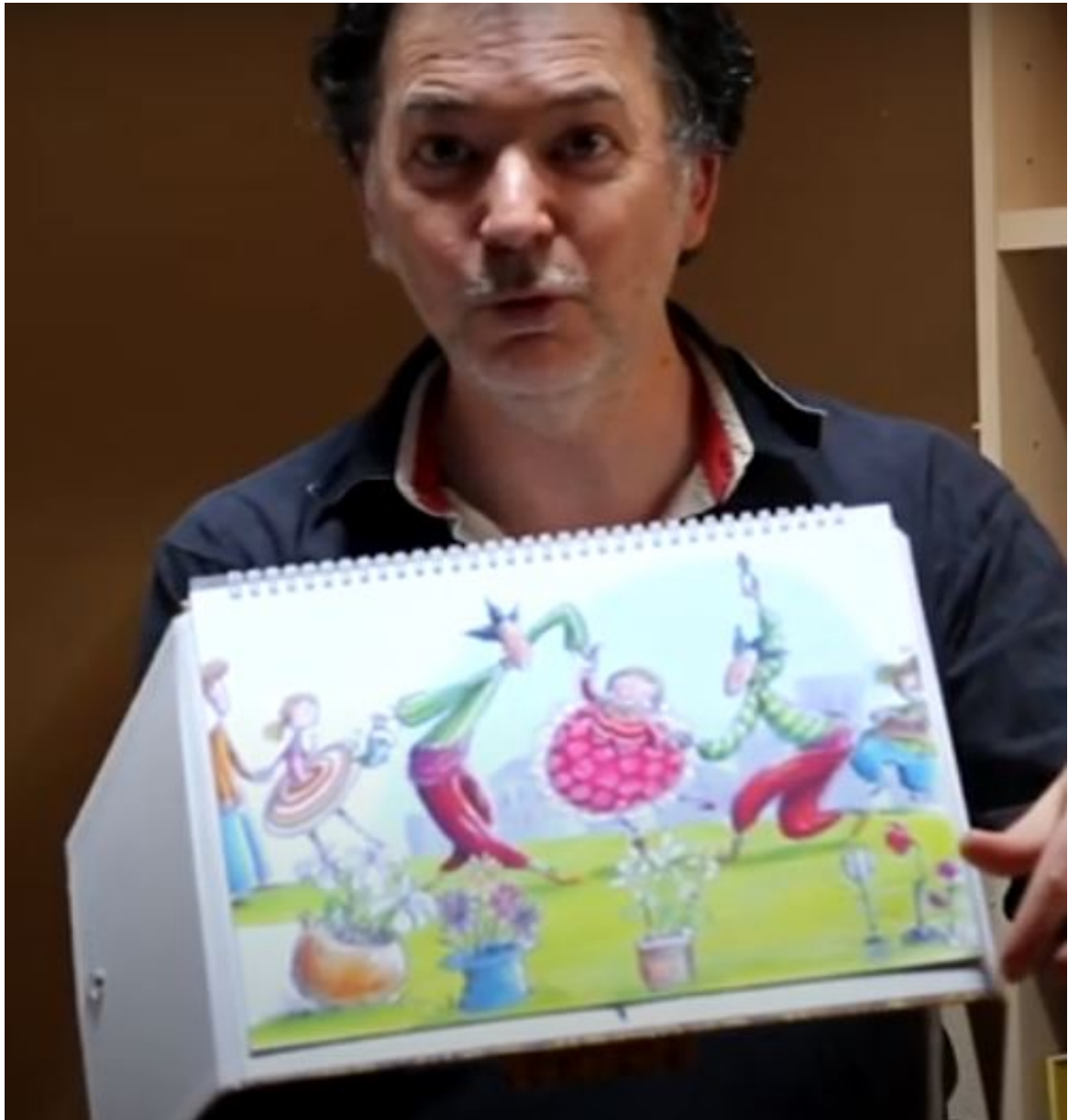
Les jumeaux cultivent les fleurs, les vendent au marché et organisent chaque année la fête au jardin