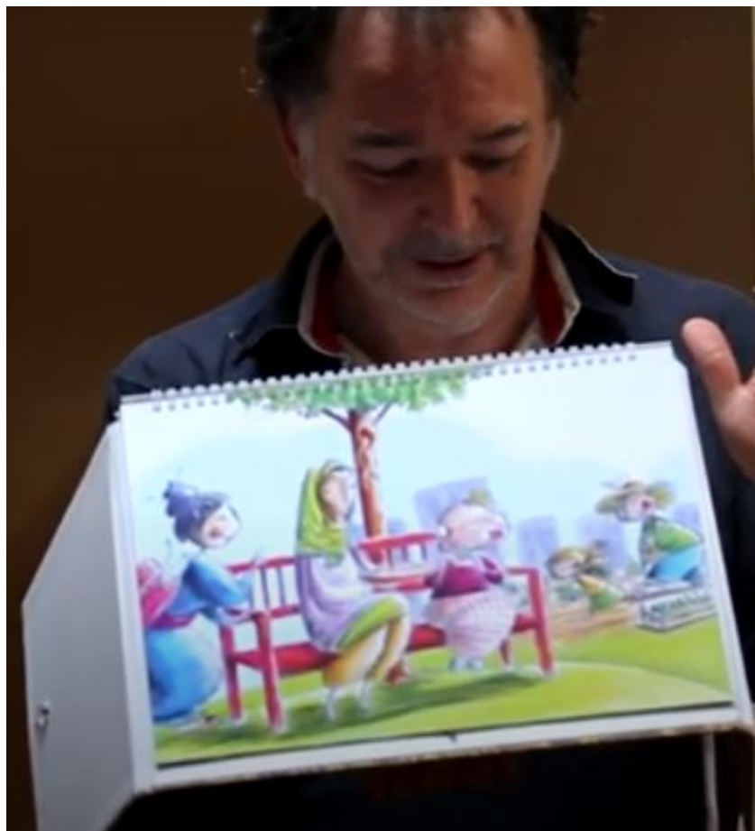
Sa maman bavarde avec les voisines et apprend le français au jardin