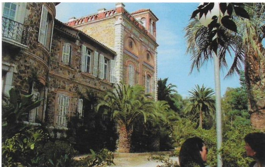
Le château Horace Vernet, vue sur la terrasse