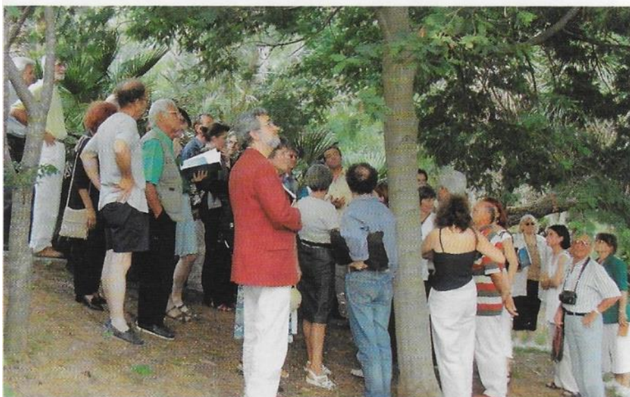
Exercice collectif d'expertise du site, entre inspecteurs des sites et jardiniers