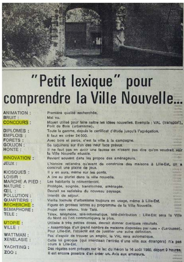
Figure 16 : lexique résumant les notions caractéristiques de la ville nouvelle de Lille-Est

Ainsi, l'habitat groupé autogéré n'est pas seulement porteur d'utopies dans sa proposition d'un nouveau mode d'habiter, mais aussi dans l'architecture qu'il propose, basée sur des principes de regroupement. L'habitat groupé autogéré est souvent comparé à l'expérience de Jean-Baptiste Godin : « l'utopie renaissante, exprimée et réalisée par les groupes d'habitats actuels permettra, peut-être, comme le familistère en son temps de transformer cette situation.