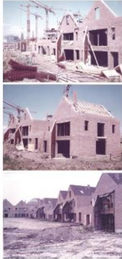
(suite des photographies de chantier)