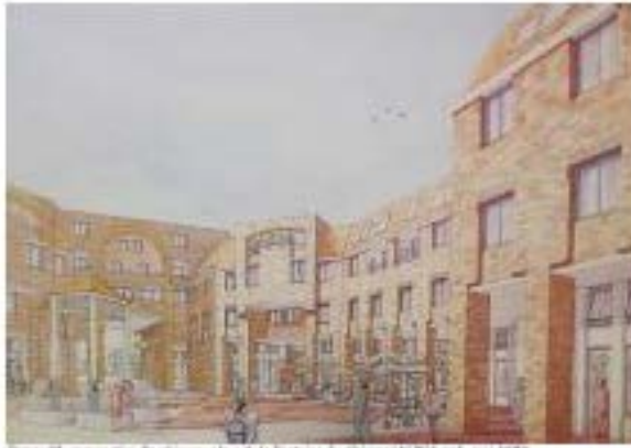
Figure 27 - perspective d'architecture, plan de la Fondation des Crieurs (ALUSIA arch. mai 1976)