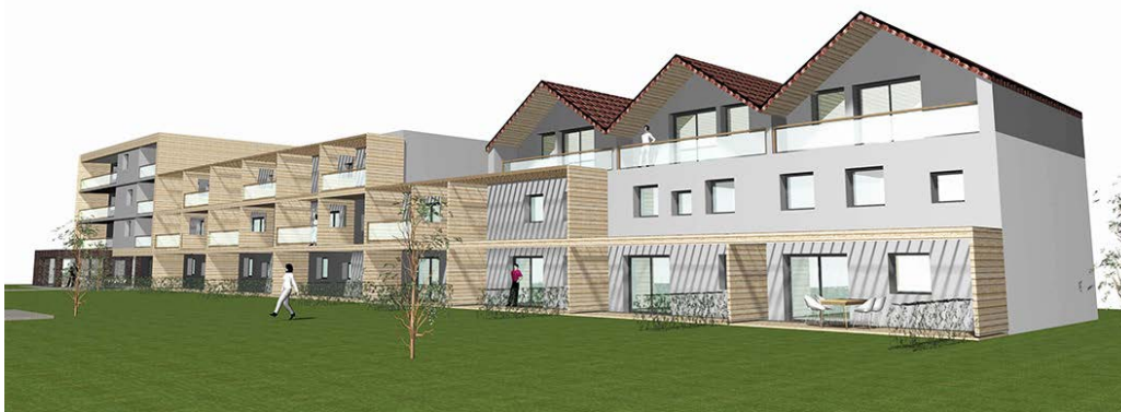
Projet de TOITMOINOUS