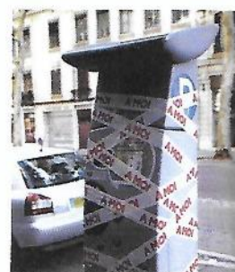
Olivier Chabanis, Appropriation d'horodateur n°1 , installation, scotch sérigraphié À MOI, photographie lambda sur alumédium, dim. variable - Olivier Chabanis / 2007.