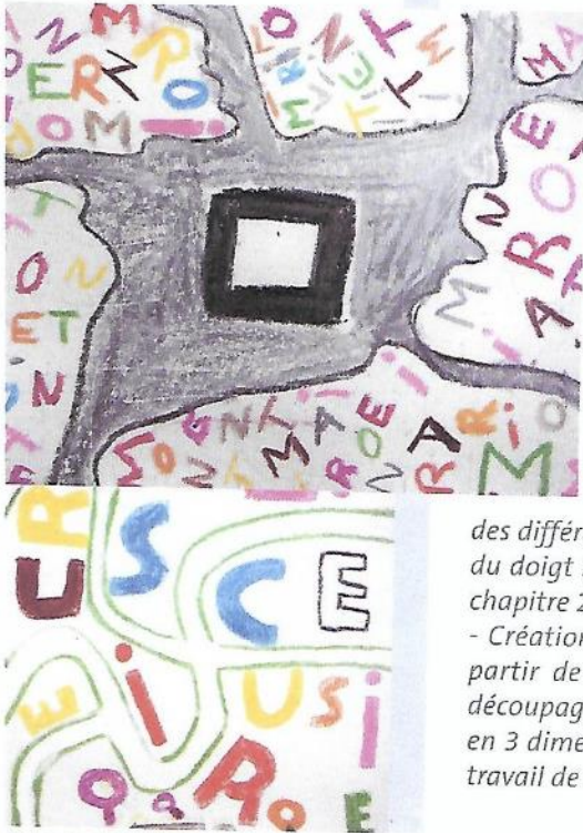
Plans de villes lettres traités au pastel, CM2, école du Village, Montferrand-le-Château.

Au cycle 3, le travail sur la « ville lettres » peut être prolongé par diverses activités :