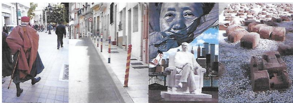
Passants à Timgad, cycle 1.