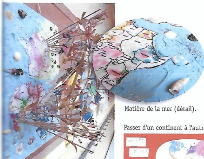
Matière de la mer (détail).