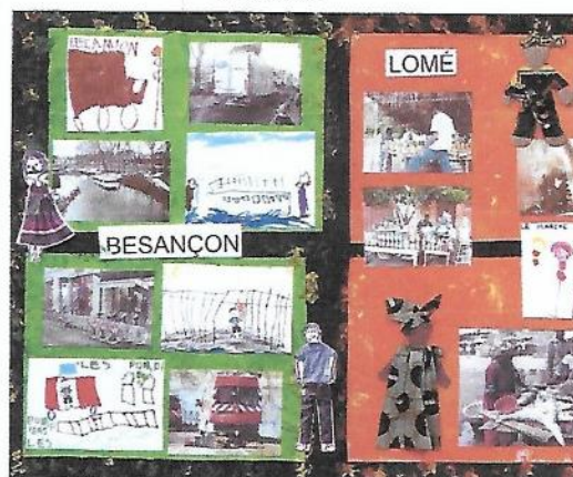
Le voyage d'un élève de moyenne sect