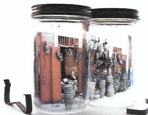
Valérie Donsbecke, En traversant la kasbah, Marrakech, 2007, photographie extraite de la série « Capture ».

Le voyage vers ces villes lointaines étant difficilement réalisable pour une classe, l'idée de voyager virtuellement d'une ville à l'autre peut donner lieu à la réalisation d'une « maquette » où figurent les continents concernés, les villes étant reliées entre elles par des rubans tendus entre deux bâtonnets (pour brochettes). Sur ce « fil », l'enfant fait voyager sa valise, sa photo, son moyen de transport favori pour un long voyage, etc.