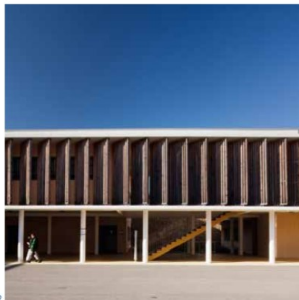
1 : Vue extérieure du collège.