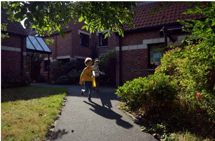
Anagram, photographie de Jean Belvisi nov.2019

Le film « Retour sur site sur l'opération d'habitat autogéré Anagram », IO5, en pleine étape de montage, après un tournage en septembre, a été perturbé dans son calendrier : prévu pour être diffusé lors des journées européennes portes ouvertes de l'Habitat participatif de mai, il sera, de ce fait, prêt pour être présenté au mois de septembre, date à laquelle ont été reportées les journées européennes portes ouvertes de l'Habitat participatif, initialement prévues en mai. LIEN 8