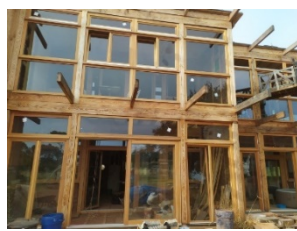
Les voisins du doman, et Bois de Brindille, juillet2020

Les mois de septembre et octobre, malgré les incertitudes quant à la possibilité de reconfinement et de refermeture des frontières européennes, sont utiles à la programmation de temps forts de dissémination des résultats du projet, bénéficiant notamment des dates de nombreux événements reportés sur septembre et octobre : Deux ateliers pour public de jeunes scolaires ont déjà pu être imaginés pour être programmés réellement